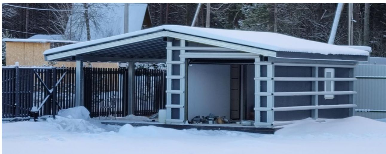
Рисунок 1 Утепленный гараж с навесом

Каркас может быть основой как для навеса, так и для утепленного и неутепленного гаража / хозблока. При этом левая и правая половины здания могут быть в разном исполнении.